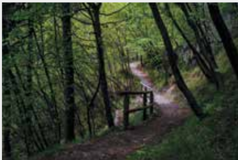
Lungo il sentiero Forte Larino / Forte Corno